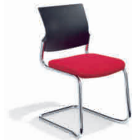
Klöber Cato cat56 Freischwinger. Kunststoff-Rücken. Gestell verchromt. Stapelbar. Ohne Armlehnen. Klöber Cato cat56 cantilever model. Polypropylene backrest. Chrome-plated frame. Stackable. Without armrests.