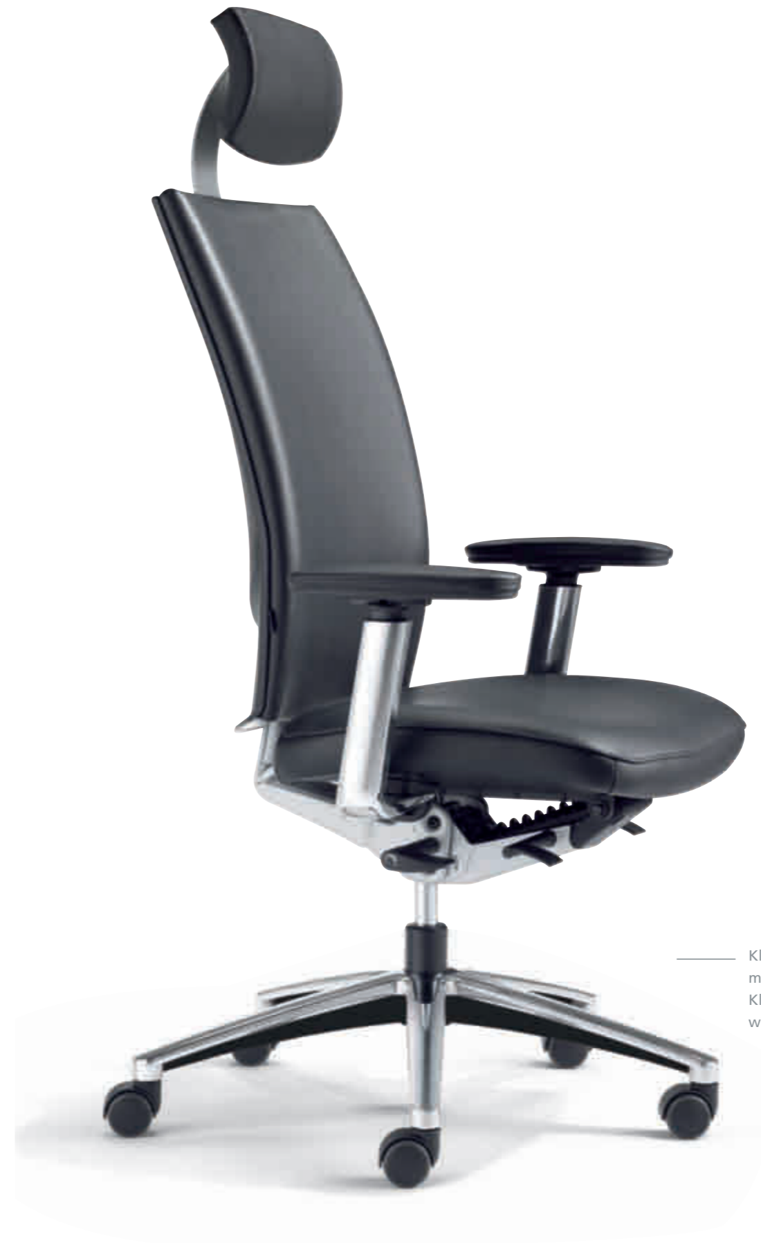
— Klöver Cato cat99 Synchron-Drehstuhl mit Kopfstütze. 4F-Armsupports. Klöver Cato cat99 synchro swivel chair with headrest. 4F Arm Supports.

So einfach wie knöpfen: die patentierte Cato Schnellverstellung zur Einstellung auf das Körpergewicht. As easy as pushing a button: the patented Cato quick-set mechanism allows adjustment to suit the user's body weight.