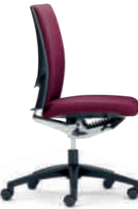
Klöber Cato cat97 Synchron-Drehstuhl. Kunststoff-Fußkreuz schwarz. Klöber Cato cat97 synchro swivel chair. Black polyamide base.