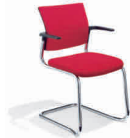
Klöber Cato cat56 Freischwinger. Polster-Rücken. Gestell verchromt. Stapelbar. Armlehnen aus glasfaserverstärktem Kunststoff. Klöber Cato cat56 cantilever model. Upholstered backrest. Chrome-plated frame. Stackable. Armrests made of fibreglass-reinforced polyamide.