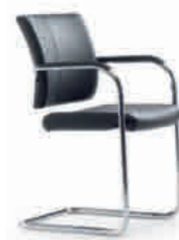
Klöber Cato Casa cca56 Freischwinger. Rücken umpolstert, Armlehnen mit Kunststoff-Auflage. Rundrohr-Gestell verchromt. Abb. zeigt Ausführung stapelbar (optional). Klöber Cato Casa cca56 cantilever chair. Back upholstered, armrests with plastic finish. Chrome-plated tubular frame. Picture shows stackable version (optional).

Armlehnen-Varianten: Z-Armlehnen (3553), optional zusätzlich mit Lederauflage (3573). 3D-Armsupports (3548), optional zusätzlich mit Lederauflage (3588). 4F-Armsupports schwarz (3557), schwarz mit Lederauflage (3577), alu-farbig (3558), alu-farbig mit Lederauflage (3578), poliert (3559), poliert mit Lederauflage (3579). MF-Armsupports schwarz (3567), alu-farbig (3568), poliert (3569). Ring-Armlehnen (3544). Die Freischwinger sind optional auch mit Armlehnen mit Lederauflage oder mit Auflagen in Ahorn natur lieferbar.