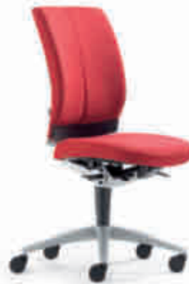
Klöber Cato Casa cca97 Synchron-Drehstuhl. Taille Kunststoff schwarz, Alu-Fußkreuz alu-farbig. Klöber Cato Casa cca97 synchro swivel chair. Waist in black plastic, aluminium-coloured base.