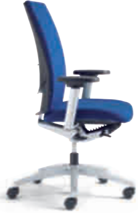
Klöber Cato cat98 Synchron-Drehstuhl. Hohe Rückenlehne, MF-Armsupports alu-farbig, Alu-Fußkreuz alu-farbig. Klöber Cato cat98 synchro swivel chair. High backrest, aluminium-coloured MF Arm Supports, aluminium-coloured base.