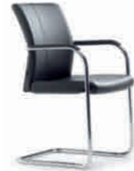
Klöber Cato Casa cca58 Freischwinger. Hoher durchgehender Rücken, umpolstert, Armlehnen mit Kunststoff-Auflage. Rundrohr-Auflage. Rundrohr-Gestell verchromt. Abb. zeigt Ausführung stapelbar (optional). Klöber Cato Casa cca58 cantilever chair. High, continuous back, upholstered, armrests with plastic finish. Chrome-plated tubular frame. Picture shows stackable version (optional).