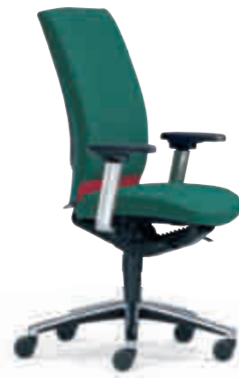
Klöber Cato Casa cca98 Synchron-Drehstuhl. Hohe Rückenlehne, Taille andersfarbig stoffbezogen. MF-Armsupports poliert, Alu-Fußkreuz poliert. Klöber Cato Casa cca98 synchro swivel chair. High backrest, waist in contrasting fabric. Polished MF Arm Supports, polished aluminium base.