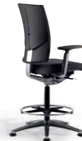
Klöber Cato cat98 Counterstuhl mit Gleitern und Fußring. Hohe Rückenlehne, 4F-Armsupports poliert, Alu-Fußkreuz poliert. Klöber Cato cat98 counter chair with glides and base ring. High backrest, 4F Arm Supports, polished aluminium base.