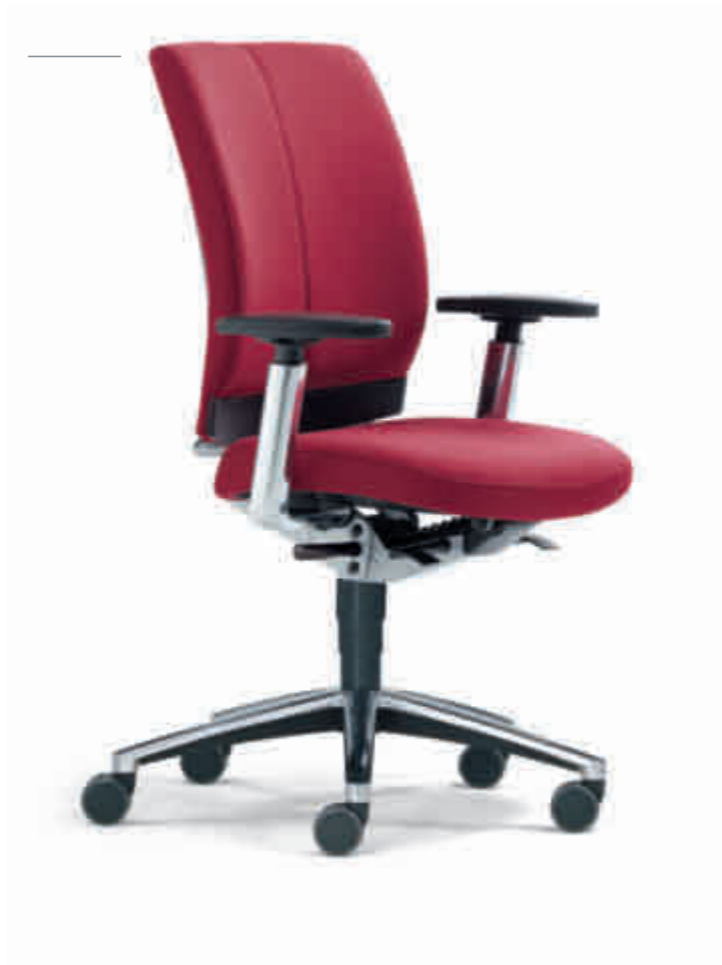
Klöber Cato Casa cca97 Synchron-Drehstuhl, Taille Kunststoff schwarz. 4F-Armsupports. Klöber Cato Casa cca97 synchro swivel chair, waist in black plastic. 4F Arm Supports.