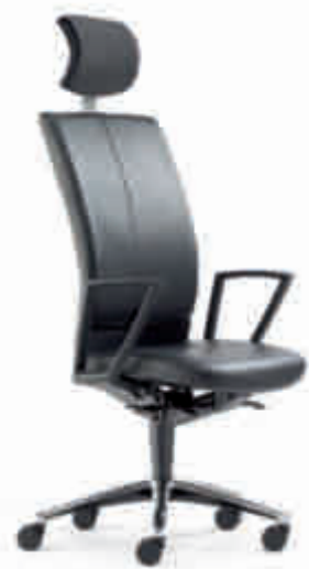
Klöber Cato Casa cca99 Synchron-Drehstuhl mit Kopfstütze. Taille gleichfarbig lederbezogen. Ring-Armlehnen, Alu-Fußkreuz poliert. Klöber Cato Casa cca99 synchro swivel chair with headrest. Waist in matching leather. Ring armrests, polished aluminium base.