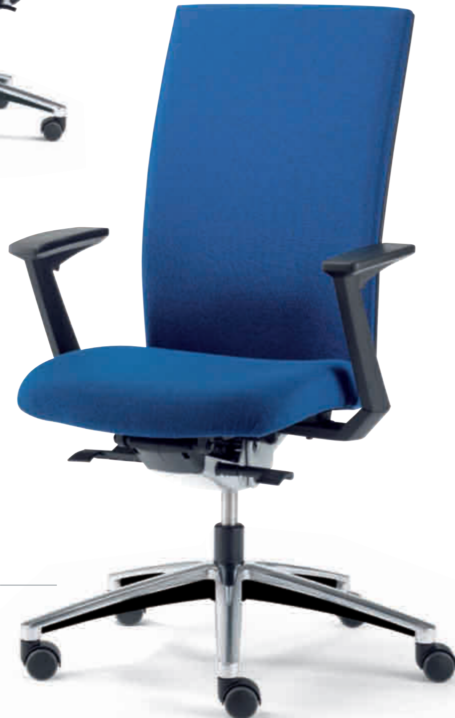
Klöber Cato cat98 Synchron- Drehstuhl. Hohe Rückenlehne. Z-Armlehnen höhenverstellbar. Klöber Cato cat98 synchro swivel chair. High backrest. Height-adjustable Z-armrests.