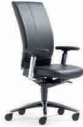
Klöber Cato Casa cca98 Synchron-Drehstuhl. Hohe Rückenlehne, Taille gleichfarbig lederbezogen. 4F-Armsupports poliert, Alu-Fußkreuz poliert. Klöber Cato Casa cca98 synchro swivel chair. High backrest, waist in matching leather. Polished 4F Arm Supports, polished aluminium base.