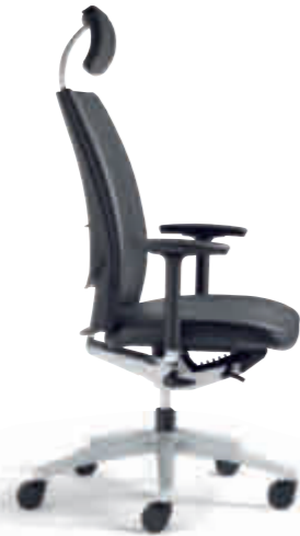
Klöber Cato cat99 Synchron-Drehstuhl mit Kopfstütze. 3D-Armsupports, Alu-Fußkreuz alu-farbig. Klöber Cato cat99 synchro swivel chair with headrest. 3D Arm Supports, aluminium-finish base.