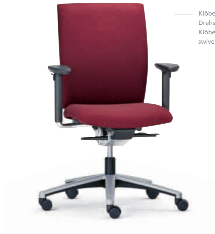
Klöber Cato cat97 Synchron-Drehstuhl. 3D-Armsupports. Klöber Cato cat97 synchro swivel chair. 3D Arm Supports.

Die einstellbare Sitztiefe und Sitzneigung vermeidet Druckstellen und verbessert die Sauerstoffversorgung. Adjustable seat depth and tilt eliminate pressure points and improve blood supply.