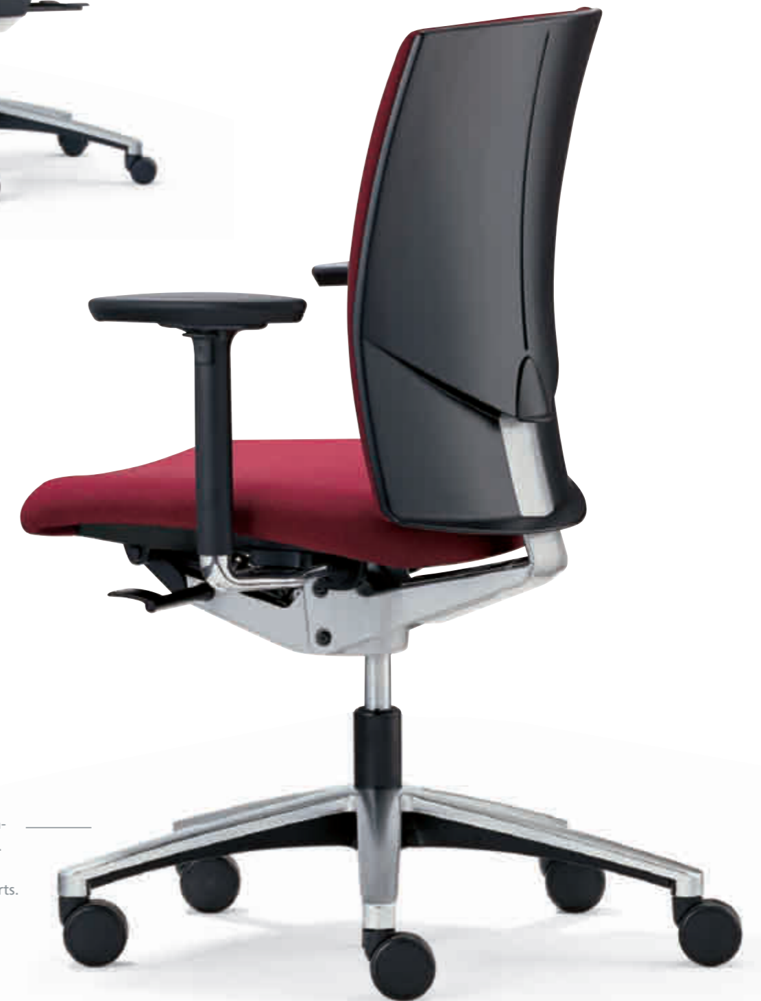
Klöber Cato cat97 Synchron-Drehstuhl. 3D-Armsupports. Klöber Cato cat97 synchro swivel chair. 3D Arm Supports.