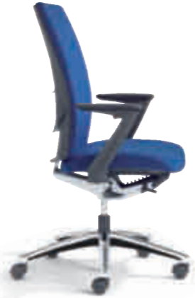
Klöber Cato cat98 Synchron-Drehstuhl. Hohe Rückenlehne. Z-Armlehnen, Alu-Fußkreuz poliert. Klöber Cato cat98 synchro swivel chair. High backrest. Z-armrests, polished aluminium base.