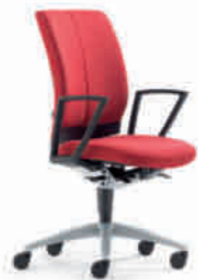
Klöber Cato Casa cca97 Synchron-Drehstuhl. Taille Kunststoff schwarz, Ring-Armlehnen, Alu-Fußkreuz alu-farbig. Klöber Cato Casa cca97 synchro swivel chair. Waist in black plastic, Ring armrests, aluminium-coloured base.

Armrest variants: Z-armrests (3553), also with leather finish as an option (3573). 3D Arm Supports (3548), also with leather finish as an option (3588). 4F Arm Supports black (3557), black with leather finish (3577), aluminium-coloured (3558), aluminium-coloured with leather finish (3578), polished (3559), polished with leather finish (3579). MF Arm Supports black (3567), aluminium-coloured (3568), polished (3569). Ring armrests (3544). The cantilever chairs are also optionally available with leather padded armrests or natural maple armrests.