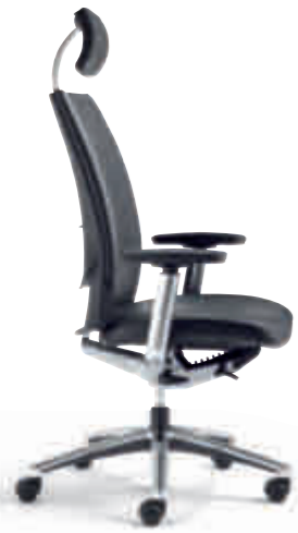
Klöber Cato cat99 Synchron-Drehstuhl mit Kopfstütze. 4F-Armsupports poliert, Alu-Fußkreuz poliert. Klöber Cato cat99 synchro swivel chair with headrest. Polished 4F Arm Supports, polished aluminium base.