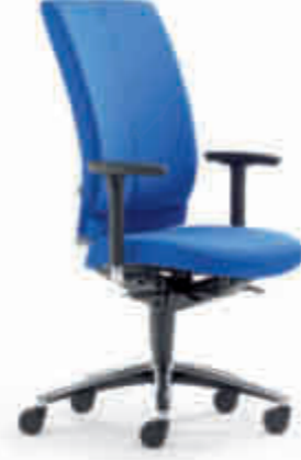
Klöber Cato Casa cca98 Synchron-Drehstuhl. Hohe Rückenlehne, Taille gleichfarbig stoffbezogen. 3D-Armsupports, Alu-Fußkreuz poliert. Klöber Cato Casa cca98 synchro swivel chair. High backrest, waist in matching fabric. 3D Arm Supports, polished aluminium base.