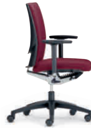
Klöber Cato cat97 Synchron-Drehstuhl. 3D-Armsupports, Kunststoff-Fußkreuz schwarz. Klöber Cato cat97 synchro swivel chair. 3D Arm Supports, black polyamide base.