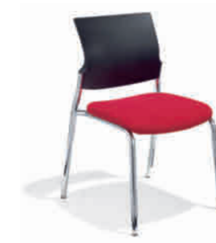
Klöber Cato cat57 Vierbeiner. Kunststoff-Rücken. Gestell verchromt. Stapelbar. Ohne Armlehnen. Klöber Cato cat57 four-legged chair. Polypropylene backrest. Chrome-plated frame. Stackable. Without armrests.