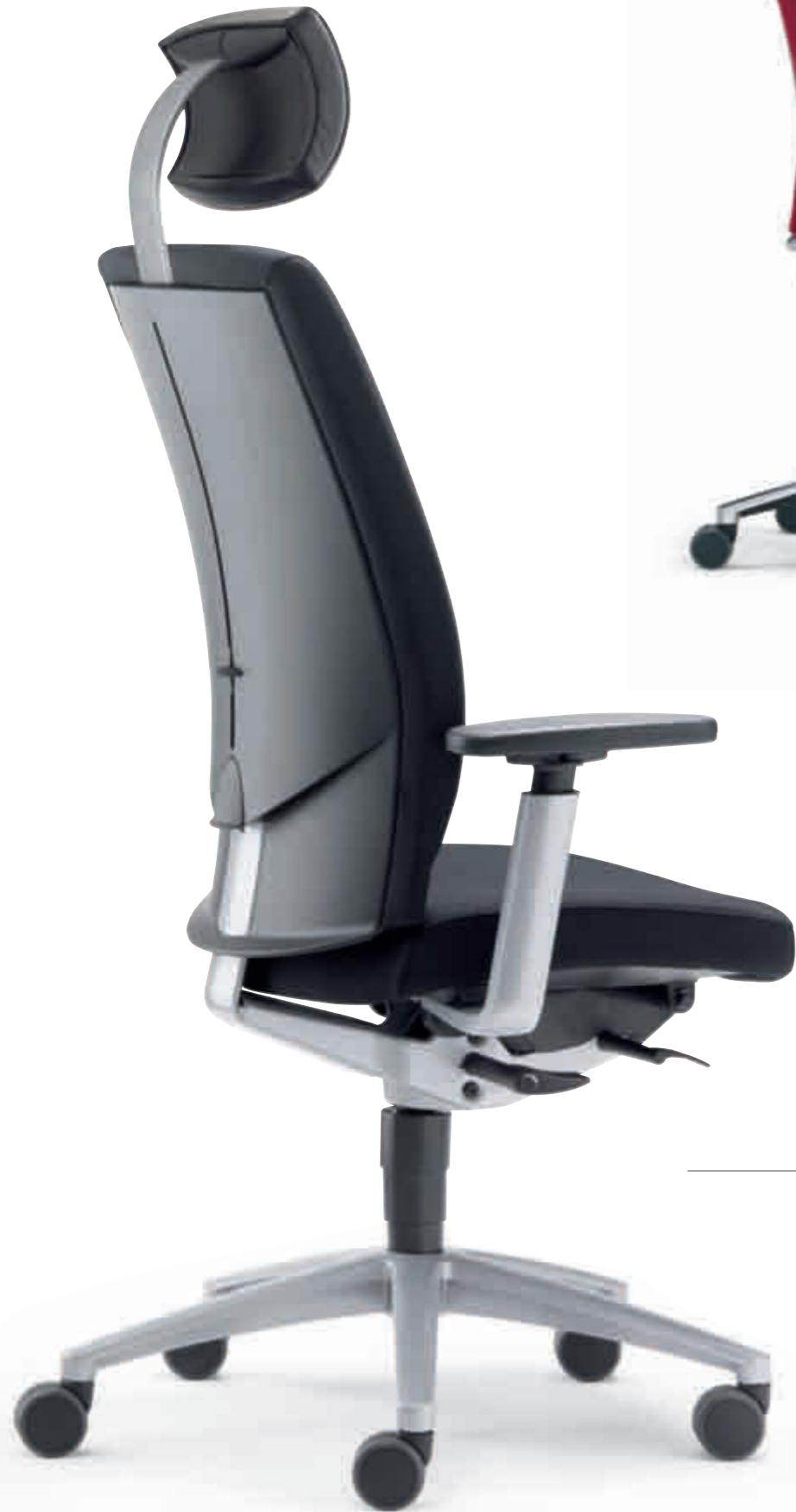
Klöber Cato Casa cca99 Synchron-Drehstuhl mit Kopfstütze. 4F-Armsupports. Klöber Cato Casa cca99 synchro swivel chair with headrest. 4F Arm Supports.

Ein Stuhl zum Anlehnen. Klöber Cato und Cato Casa eröffnen alle Optionen für entspanntes Sitzen, Rundum-Komfort und damit gesteigerte Konzentrationsfähigkeit. Beispiel Armlehnen: zur Wahl stehen MF-Armsupports, 4F-Armsupports, 3D-Armsupports, höhenverstellbare Z-Armlehnen oder Ring-Armlehnen. Zur Entlastung im Schulter- und Nackenbereich.