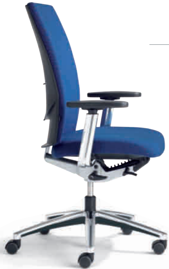
Klöber Cato cat98 Synchron-Drehstuhl. Hohe Rückenlehne. 4F-Armsupports. Klöber Cato cat98 synchro swivel chair. High backrest. 4F Arm Supports.