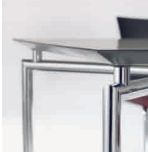
Klöber Carrée car28 Konferenz-Tisch. Gestell verchromt. Köber Carrée car28 conference table. Chrome-plated frame.