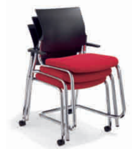
Klöber Cato cat56/cat57 Stapel bestehend aus Vierbeiner mit schwenkbaren Rollen, Freischwinger und Vierbeiner. Gestell verchromt. Klöber Cato cat56/cat57 stack consists of four-legged chair with swivel castors, cantilever model and four-legged chair. Chrome-plated frame.

Armlehnen-Varianten: Z-Armlehnen (3553), optional zusätzlich mit Lederauflage (3573). 3D-Armsupports (3548), optional zusätzlich mit Lederauflage (3588). 4F-Armsupports schwarz (3557), schwarz mit Lederauflage (3577), alu-farbig (3558), alu-farbig mit Lederauflage (3578), poliert (3559), poliert mit Lederauflage (3579). MF-Armsupports schwarz (3567), alu-farbig (3568), poliert (3569). Ring-Armlehnen (3544). Armrest variants: Z-armrests (3553), also with leather finish as an option (3573). 3D Arm Supports (3548), also with leather finish as an option (3588). 4F Arm Supports black (3557), black with leather finish (3577), aluminium-coloured (3558), aluminium-coloured with leather finish (3578), polished (3559), polished with leather finish (3579). MF Arm Supports black (3567), aluminium-coloured (3568), polished (3569). Ring armrests (3544).