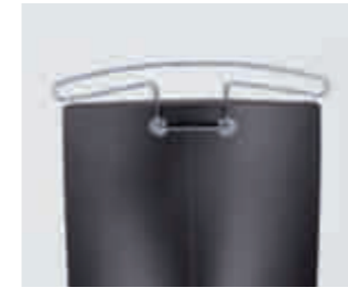
Praktischer Kleiderbügel. Practical coat hanger.

Vollkommener Gleichklang. Die perfekte Synchronmechanik passt den Bewegungsablauf von Sitz und Rückenlehne punktgenau der menschlichen Bewegung an. Vorteile: kein „Hemdauszieh-Effekt“. Und jederzeit optimale Abstützung der Wirbelsäule.