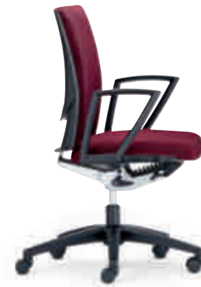
Klöber Cato cat97 Synchron-Drehstuhl. Ring-Armlehnen, Kunststoff-Fußkreuz schwarz. Klöber Cato cat97 synchro swivel chair. Ring armrests, black polyamide base.