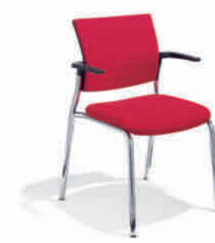
Klöber Cato cat57 Vierbeiner. Polster-Rücken. Gestell verchromt. Stapelbar. Armlehnen aus glasfaserverstärktem Kunststoff. Klöber Cato cat57 four-legged chair. Upholstered backrest. Chrome-plated frame. Stackable. Armrests made of fibreglass-reinforced polyamide.